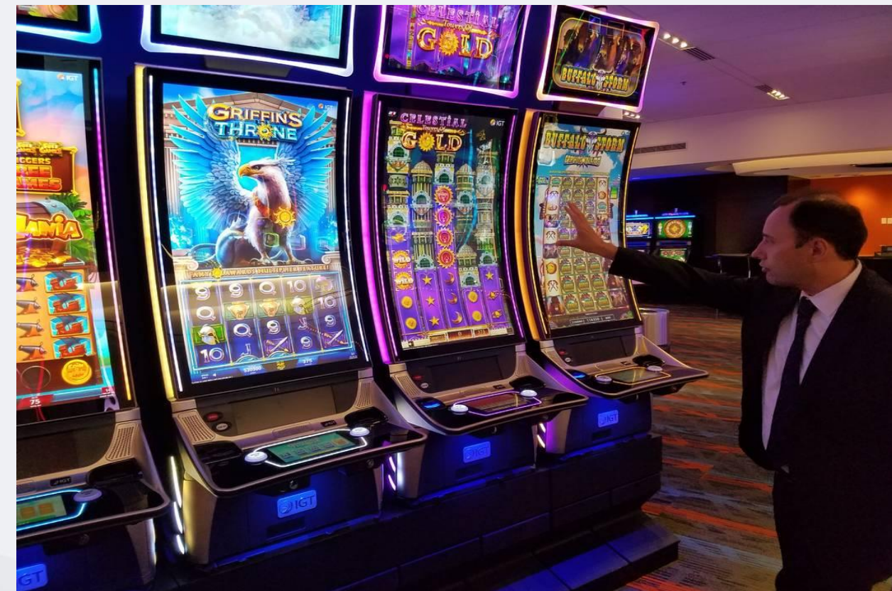
CASINO GAME TRADE